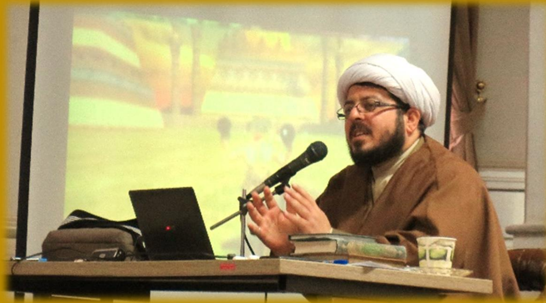
تصاویر این کلاس: